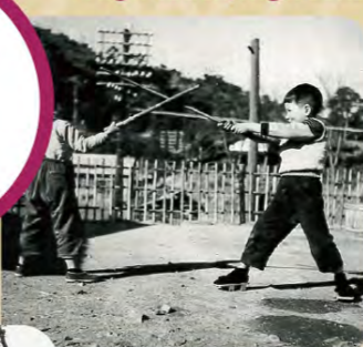
元気が一番！（左・本人） チャンバラ遊び（右・本人）

鳴呼！懐かしきお正月 幼少期は自然に囲まれた熱海市網代で過ごしていました。あの頃「お正月」は、松飾り・おせち料理・雑煮など、各家庭のほとんどが手作り。近隣の方々皆での恒例行事「餅つき」、大人が早朝からお餅を作っている傍で、我々子供は「ベーゴマ」「竹馬」「めんこ」「チャンバラ」などで遊びまわっていたのは、忘れられない思い出。田舎の大人達は「皆で子供を育てよう」「助け合おう」と、「お隣さん」的な生活共同体を作っていましたね。今の自分の基本となる部分は、田舎での暮らしの経験で得たものなのだろうと痛感する、今日この頃です。皆様にとって良い年になりますように！！