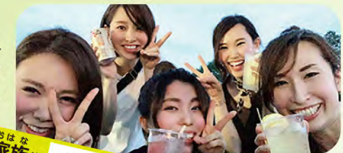
おはな家族だと... 真面目な長女？

いつもの5人の友人と、大好きなお酒や鮎の塩焼き、鰻の串焼きをおつまみに、祭りを楽しんでいます。また、北関東の露店にしかないレインボーアイスは必ず食べます。そんな地元のお祭りに行くと、子供を抱いている知り合いに遭遇することもしばしば。その度に、子供って良いなあ～と思います。(予定は未定・・・) 来年はこの5人の友人のうち2人が出産を終え、祭り仲間が増えます！