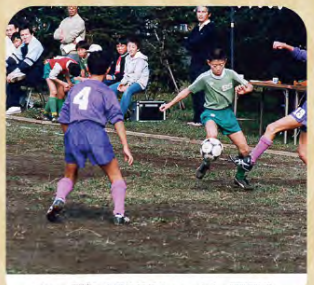
第7回 熱海地区選抜サッカー大会