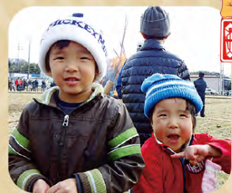
平成の長男と次男！