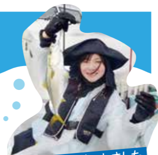
おおきなイナダがつかれました

泰大会では様々な部活動を行っています。以前にもおさじで紹介した「筋トレ部」(おさじvol29)やバンド活動(Tye-Dye-Quintet)、ゴルフ部などがあり日々の疲れをリフレッシュしています。今回は新たに設立された「釣り部」の活動を紹介します。