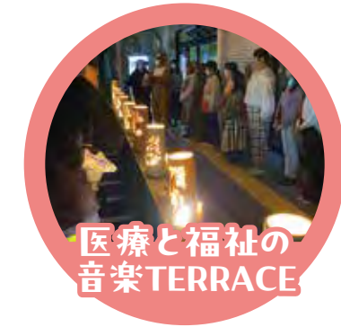
医療と福祉の 音楽TERRACE