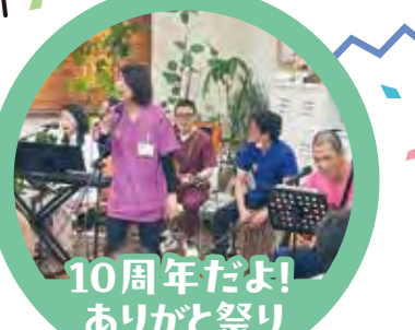
10周年だよ! ありがとう祭り