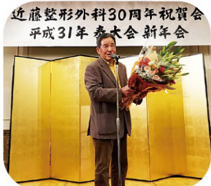
万感の思いが伝わってきます！

四半世紀を超える道のりは、間違っていなかった…！「目配り・気配り・思いやり」一筋の信念が、今の泰大会を作ってきたことを、まじまじと実感しました。こうなると30年後も楽しみですね。スタッフ一同益々腕に磨きをかけ、より一層医療の為に邁進していくことでしよう。乞うご期待！(担当：苅田)