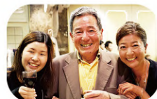
両手に花の晴れ姿！