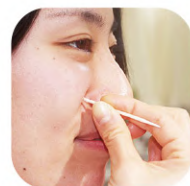
中級（つまようじの柄）