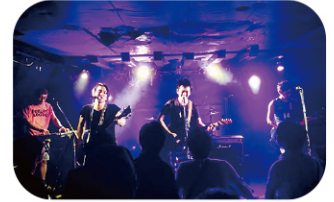
年に2回はバンドでステージで演奏!音楽はロックに限る!!

この趣味の延長で、最近流行りのロックフェスティバルに参加することが毎年のルーティンになっています。