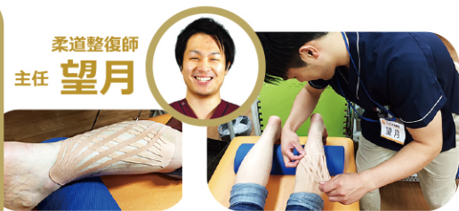
テーピングにより日常動作での痛みを抑制します。